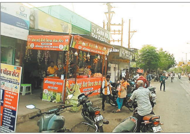
कोनी क्षेत्र में सड़क के दोनों तरफ टैले, गुमटी और दुकान वाला ने कर रखा है कब्जा, व्यापारियों ने सड़क पर फैला रखा है सामान।